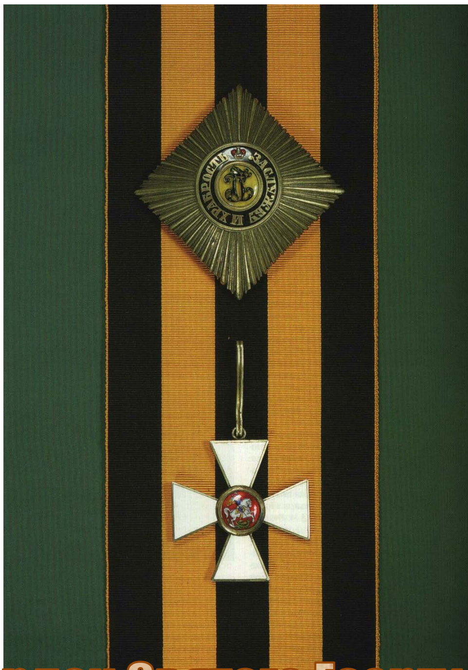
Орден Святого Георгия. Учреждён в 1769 году.