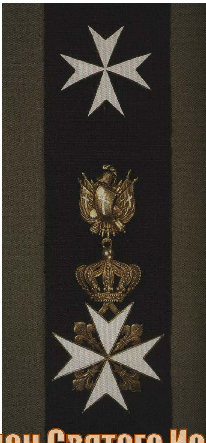
Орден Святого Иоанна Иерусалимского