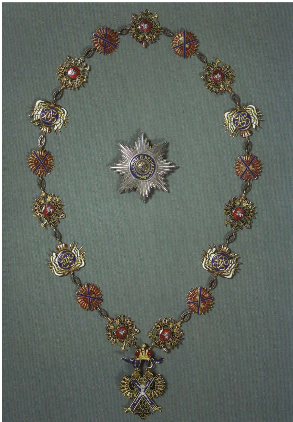
Орден Святого Андрея Первозванного. Учреждён в 1698 году.