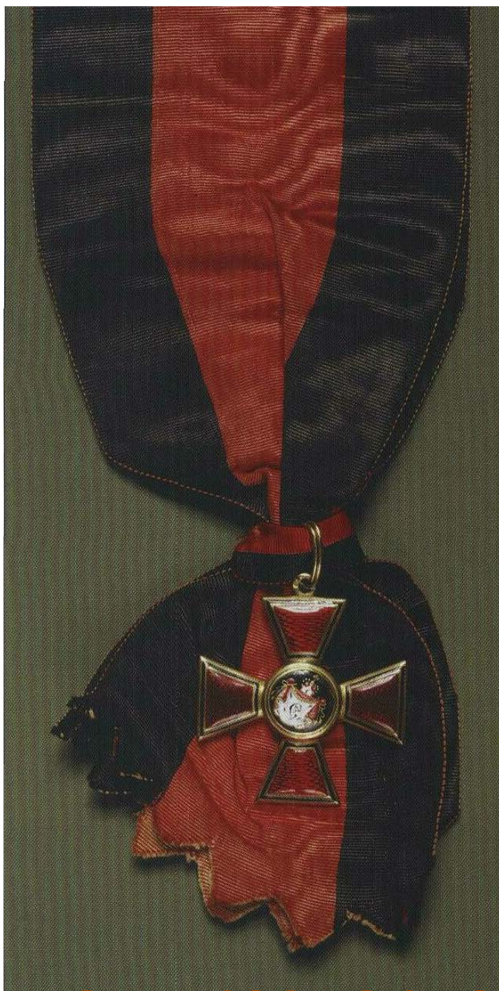
Лента и крест ордена Святого Владимира, учреждённого в 1782 году