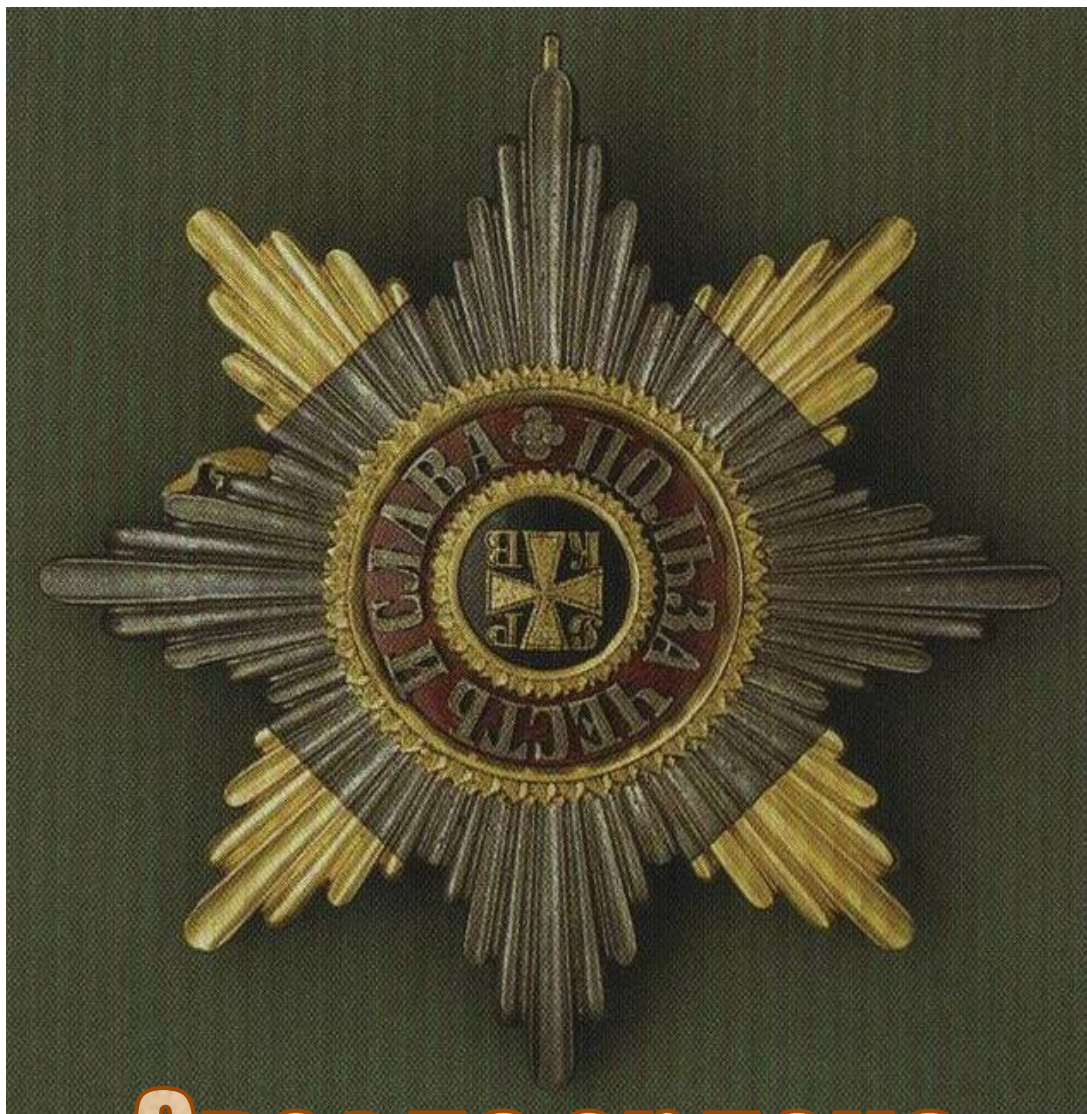
Звезда ордена Святого Владимира