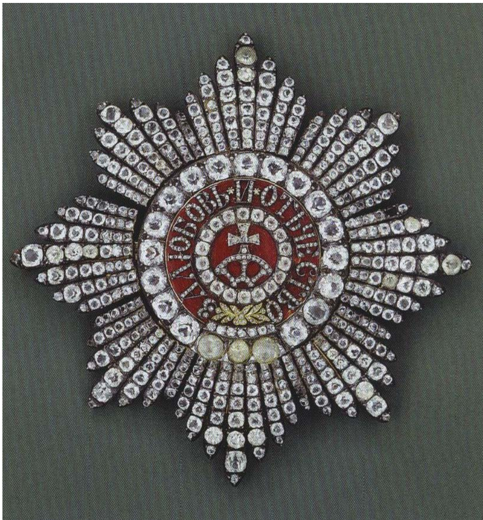
Орденская звезда Святой Екатерины