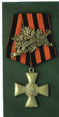
Солдатский Георгиевский крест «с веточкой» для награждения офицеров. 1917 г.