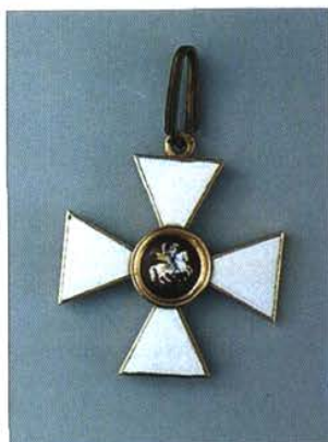
Орден св. Георгия 4-й ст.