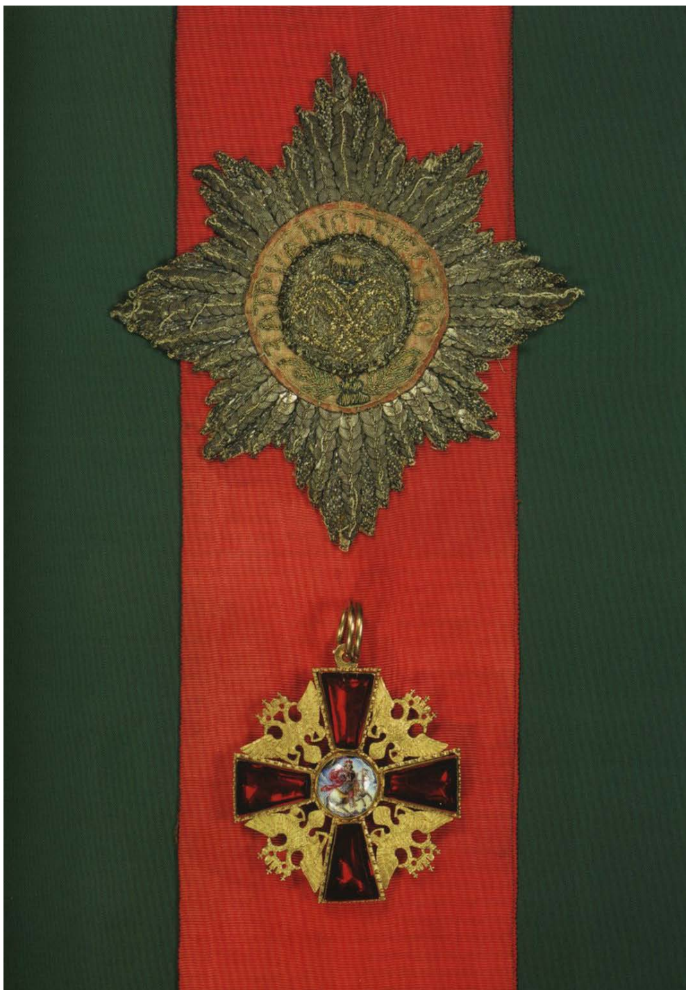
Орден Святого Александра Невского. Учреждён в 1725 году.